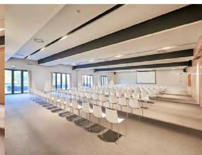
Sala Ceuta 1+2