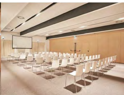
Sala Ceuta 2